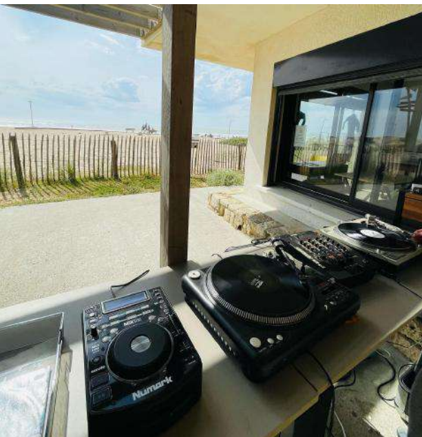
Apéro, dj SET et fresque collective au Cube à Monta