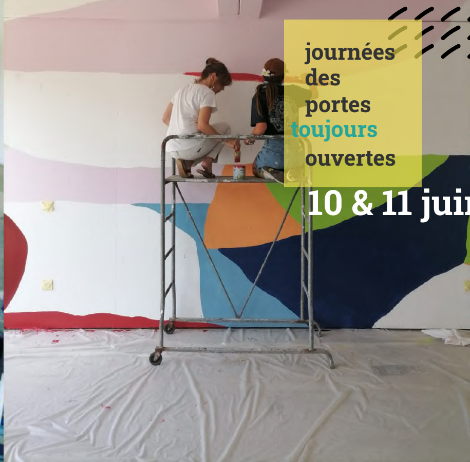
Atelier participatif artistique chez SEA au Verdon